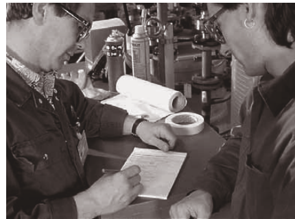
Bild 6: Wenn sich die Brand- und Explosionsgefahr nicht restlos ausschliessen lässt, ist eine schriftliche Schweisserlaubnis nötig.