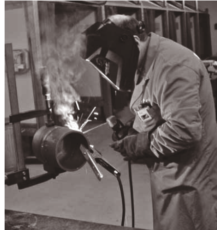
Bild 1: Vor Beginn der Arbeiten muss sich der Schweißer davon überzeugen, dass die Schweißstromrückleitung einwandfrei angeschlossen ist.