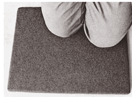
Bild 3: Der Lichtbogenschweißer schützt sich mit einer isolierenden Unterlage und Sicherheitsschuhen vor Stromschlägen.