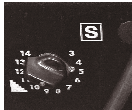
Bild 2: Kennzeichnung [S] für Schweißstromquellen bei Arbeiten unter erhöhter elektrischer Gefährdung.