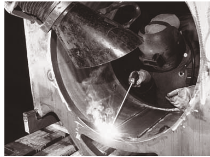
Bild 4: Trichterförmige, flexible Einrichtung zum Erfassen und Absaugen von Schweisssrauch.