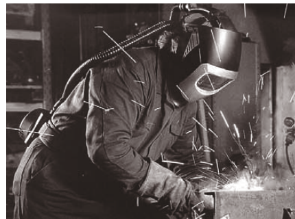
Bild 5: Beim Lichtbogenhandschweißen oder Plasmaschneiden von legierten Werkstücken an schlecht belüftbaren Stellen muss ein Schweisserhelm mit Frischlufsystem benutzt werden.